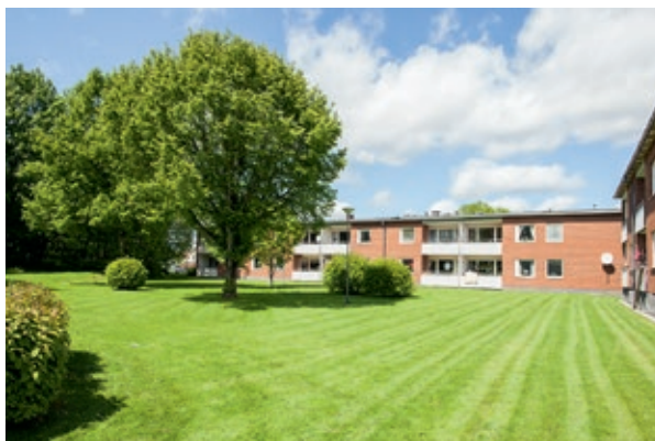
I korsningen Västergårdsgatan – Nästegårdsgatan, ligger den utemiljö som eleverna jobbat med att planera. I vinnarnas förslag fanns gott om platser att umgås, och flera träd för att skapa skugga.