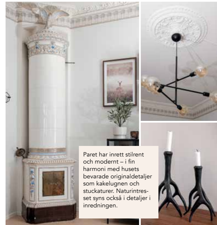
Paret har inrett stilrent och modernt – i fin harmoni med husets bevarade originaldetaljer som kakelugnen och stuckaturer. Naturintresset syns också i detaljer i inredningen.

– Ett stort garage behöver huset ha, säger han.