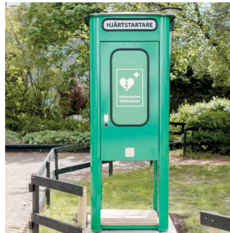
På Slöjdarens innergård installerades nyligen en hjärtstartare. Ytterligare en hjärtstartarkiosk har satts upp på Stationsvägen i Ljung.